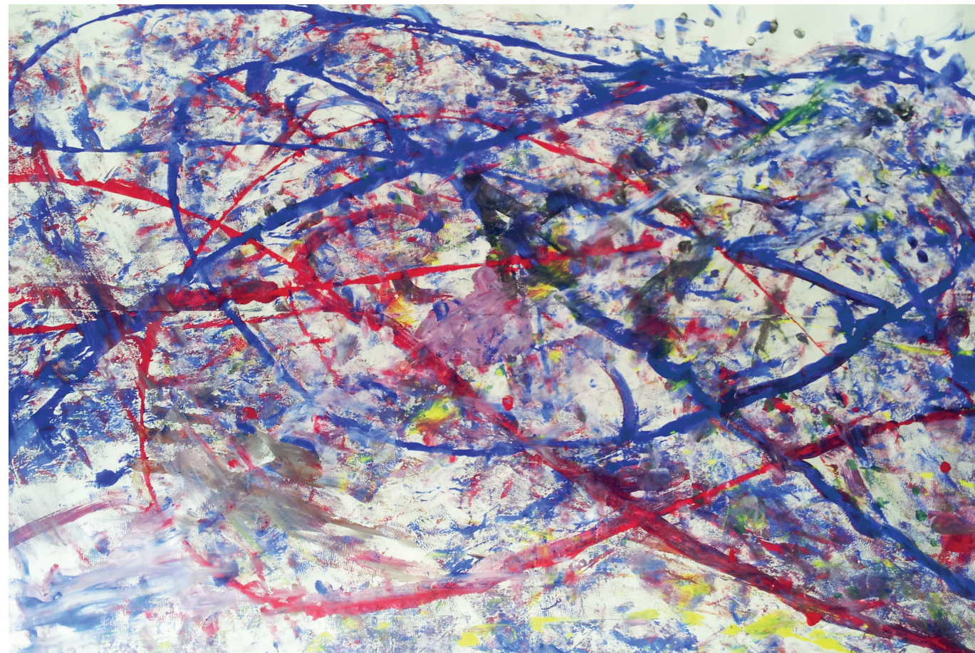
Schilderen vanuit impuls – augustus 2015