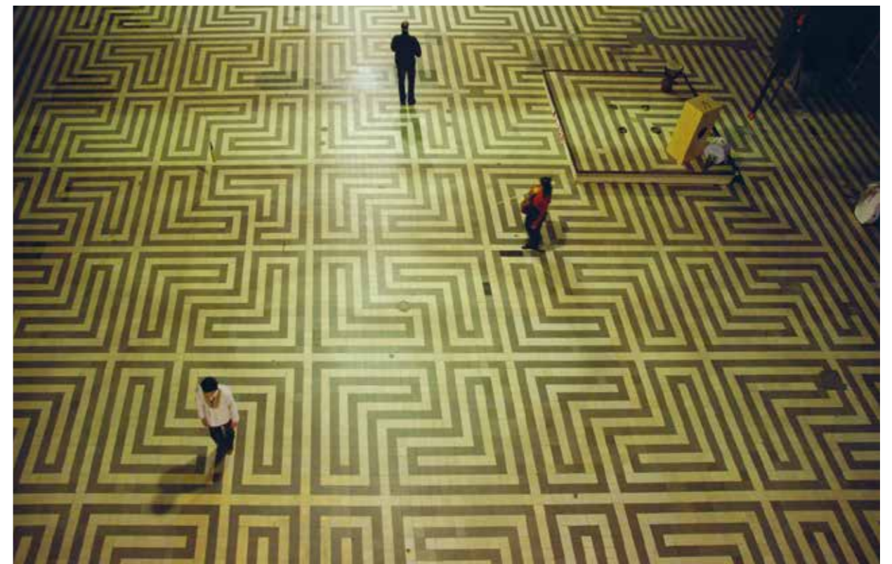
Op zoek naar de ongezochte vondst