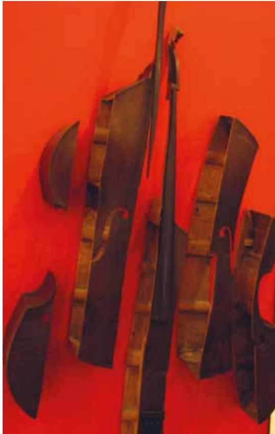
Fragmenten in context

van dit verhaal, met de birdcall de straat op. Er is geen vaste plek meer zoals de concertzaal voor musici, het theater voor acteurs of de galerie voor beeldend kunstenaars. De straat is openbare ruimte. Die is van iedereen die aanwezig is. Wat de Urban Dancers doen is een touw neerleggen op de grond. Daar begint het podium. En ze trekken de aandacht door te bewegen, maar ook te roepen: "what time is it?... showtime!!" Langzaam zie je de ene na de andere passant stil houden en heel geleidelijk transformeren tot publiek. Er volgen uitnodigingen om dichterbij te komen tot bij het touw. Want anders ben je zo weer weg als passant. Hoe dichterbij het touw, hoe meer publiek. Gedurende het optreden wordt de band met het publiek telkens onderhouden en verdiept. Belangrijk, want er moet aan het eind wel betaald worden. Dus de bereidheid tot betalen moet worden aangewakkerd. Metaforisch grijpen de twee thema's nu helemaal in elkaar: 'de artist in society onderneemt in verandering'. Mijn vijfde en laatste wending komt hieruit voort.