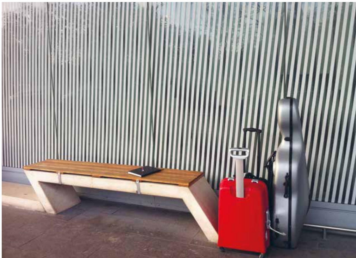
Onderweg van Dartington naar Groningen