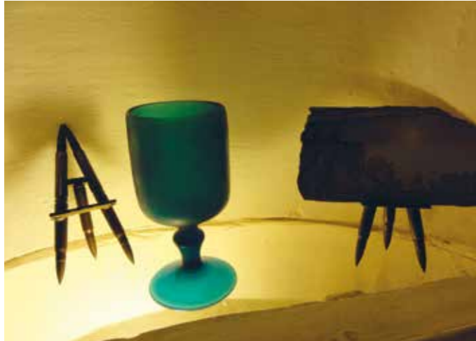
Leren wat je al weet

in society', ook met 'ondernemen in verandering' en ook in het hele concept van een 'razendsnel veranderende wereld vraagt van ons...'. Al die concepten hebben een wenkend perspectief in zich, een horizon, het gras van de buurman dat groener is, ergens heen gaan waar het beter is dan hier en nu. Ook ons denken over leren is onbewust vaak zo gestructureerd. Je gaat iets leren wat je nog niet weet, wat je nog niet kan. Het bezwaar dat ik hiertegen heb is dat er door die roep om het nieuwe en andere makkelijk overheen gekeken kan worden over dat wat professionals (in welk beroep dan ook) eigenlijk doen. De wending die ik voorstel is om meer te doen met 'waar we zijn'. Bewust worden van wat je doet maakt ruimte om het anders te doen. Dat werkt sterker dan voorbijgaan aan wat je nu doet en iets nieuws proberen te doen. Dus ook hier is de werking van de muzen van belang. Bezingen wat er gaande is. Dan komt er (minder kunstmatig? vanzelf?) verandering. Er is een prachtige en bovendien eenvoudige oefening om zicht te krijgen op de waarden van wat je nu doet, om die te bezingen. Marcus Aurelius, de grote en geliefde Romeinse keizer, schreef een boekje dat Overpeinzingen heet. In plaats van al zijn heldendaden te benoemen beschrijft hij eerst wat hij van wie leerde. Van mijn grootvader... van mijn vader... En zo gaat